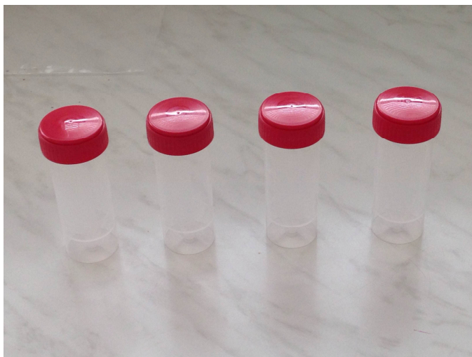
Obr 3: Vzorkovnice.

Zmesné vzorky po odbere odovzdajú chovatelia na regionálnej veterinárnej a potravinovej správe. Táto zabezpečí vypísanie sprievodného dokladu a odošle vzorky do národného referenčného laboratória v Dolnom Kubíne alebo veterinárnych a potravinových ústavov Bratislava a Košice.