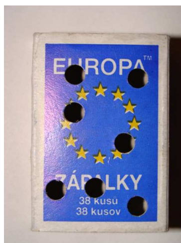
Obr. 2: Dierkovačom perforovaná krabička zabezpečuje, aby vzorka neporástla plesňami. Pred predierkovaním vrchnáka vyberte vysúvaciu časť, aby ostala neporušená.

Ak je vzorka príliš vlhká, je možné ju nechať v otvorenej škatuľke čiastočne presušiť pri izbovej teplote počas 12-24 hodín. Vzorky nesušte na radiátore !!!! Pri balení vzoriek pred odoslaním používajte len priedušné materiály (papier, papierové krabice). Nevkladajte vzorky do igelitových vreciek a obalov , nakoľko takto zabalené vzorky plesnivujú a skresľujú výsledky získané z Vašich vzoriek !!! Vzorky balené do nepriedušných igelitových obalov nebudú vyšetrené.